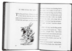
小説「不思議の国のアリス」